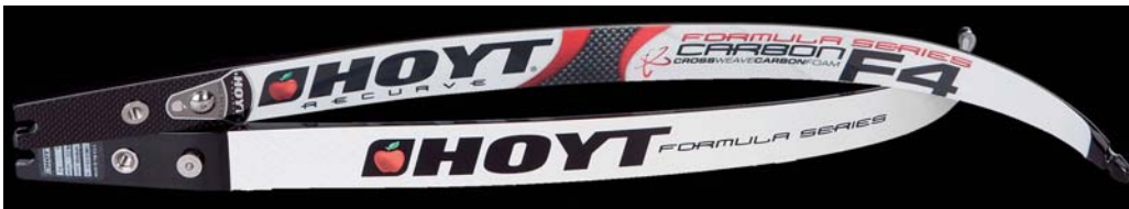
WURFARME FORMULA F4 (546,00 €)

Wurfarme auf hohem Niveau, die anstelle synthetischen Schaums einen Holzkern verwenden.