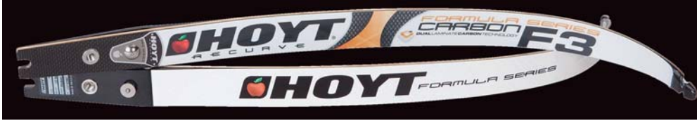
WURFARME FORMULA F3 (525,00 €)

Mit dem Mittelteil Formula RX können zwei Wurfarme kombiniert werden: